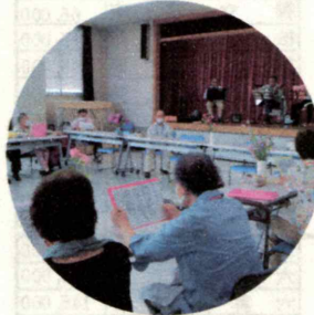
ふれあい・ いきいきサロン