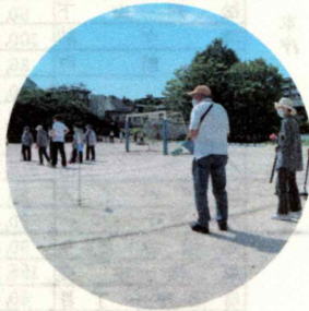
グラウンドゴルフ 大会