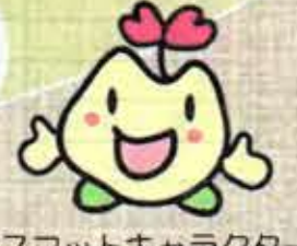
マスコットキャラクター まっころん