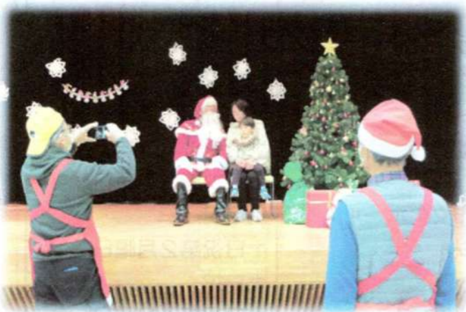
子育てサロン 保護者や子どもが交流できる憩いの場