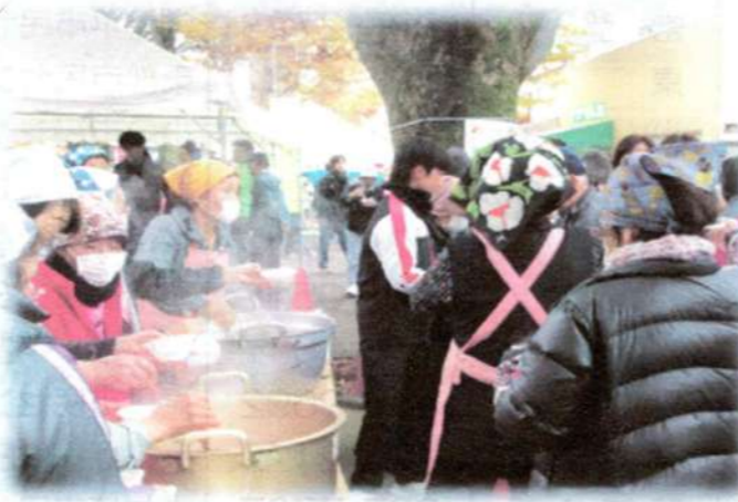
ふれあい広場 地域住民が世代を越えて交流を深める一大イベント