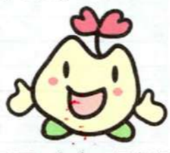
マスコットキャラクター まっころん