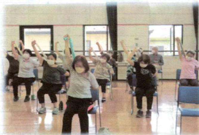
ふれあい・いきいきサロン 地域に暮らす誰もが気軽に参加できるふれあいの場