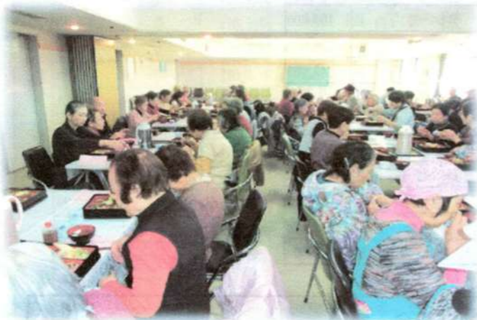
ふれあい会食会 高齢者に外出の機会と交流の場を提供