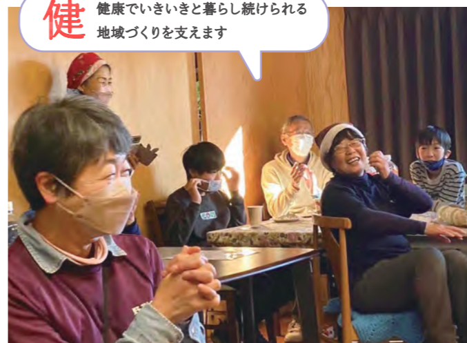
児童デイサービスクリスマス会(山武市)