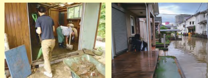
令和5年9月の台風15号接近による大雨災害復興支援