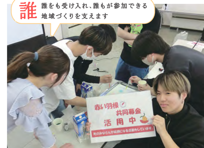
春休みボランティア体験~科学実験教室~(野田市)