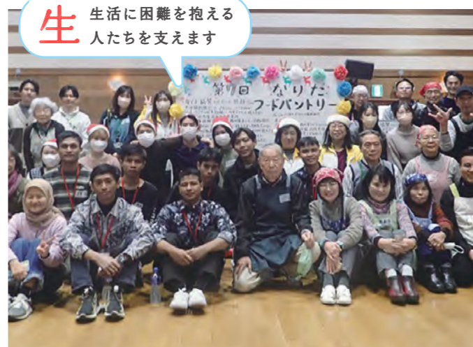
フードパントリー(成田市)