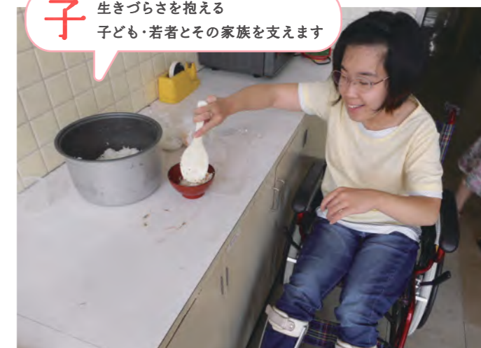
自立生活支援<体験実習>(千葉市)